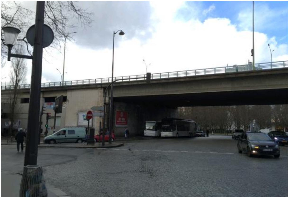
Photo du point de rencontre pour prendre l'autocar

Pour celles et ceux qui le souhaitent, il est possible d'être hébergé-e à Paris le lundi soir par un-e adhérent-e de David & Jonathan, pour prendre un avion ou un train le mardi matin.